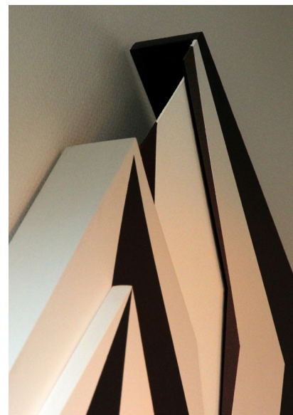
LILITH, detalj.

Född i Valparaiso, Chile 1968. Bosatt i Åmål sedan 2007