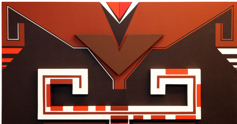
BLODSBAND II (Consanguinidad II), akryl på trärelief, 50 x 95 x 7 cm.