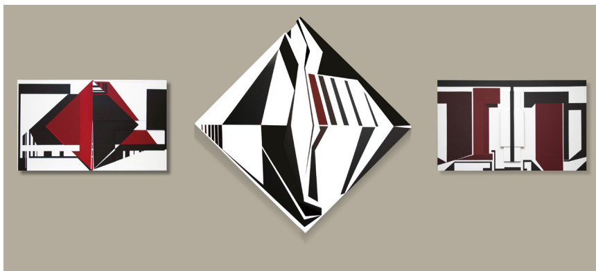
Triptyken "OLYMPE-LILITH-MADONNA" 172 x 445 cm. Inköpt av Värmlands landstings konstnärhet. Akryl på trärelief.